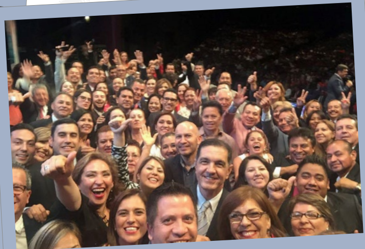
Tus sueños, nuestra inspiración