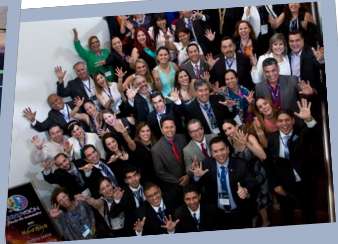
Seminario Líderes Diamante, Diamante Ejecutivo y Platino