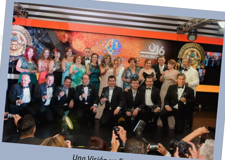
Una Visión un Equipo